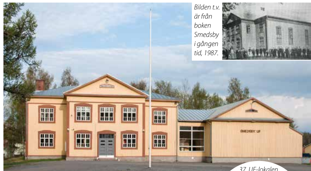
Bilden t.v. är från boken Smedsby i gången tid , 1987.