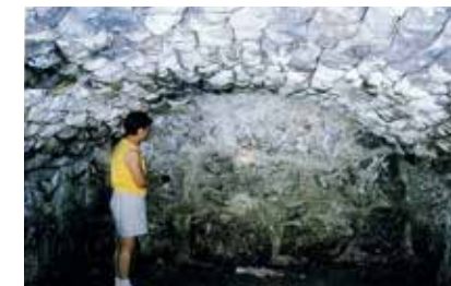
Bilden av stenkällaren är från boken Smedsby 1940–2002.