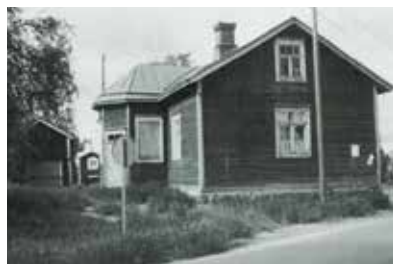
Bilden av barnskolan är från boken Smedsby i gången tid, 1987.