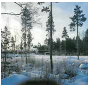
Ämbetshusets tomt 1978.