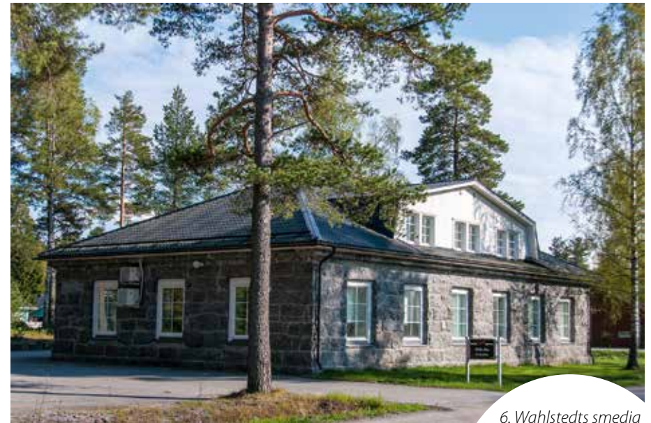
6. Wahlstedts smedja