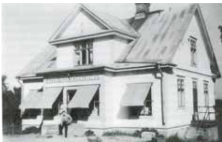
Bilden t.v. är från boken Smedsby 1940–2002.

Byns första butik, andelshandeln, verkade här från 1920-talets början till slutet av 1970-talet. Den ursprungliga affärsbyggnaden revs i början av 1930-talet och ersattes av en ny, i dag ombyggd till bostadshus. Smedsbyvägen gick tidigare genom gårdsplanen mellan butiken och lagerbyggnaden.