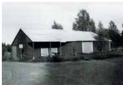
Bilden är från boken Smedsby 1940–2002.