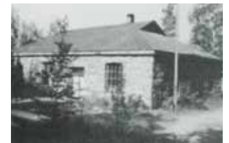
Bilden är från boken Smedsby i gången tid, 1987.